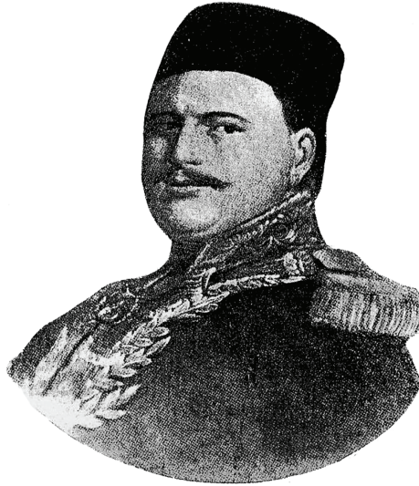
الأمير محمد سعيد وهو أمير البحار في الأسطول المصري.

فالنسبة إلى الملكية العقارية أول ما اتجه إليه فكر الوالي إصدار أمر في سنة ١٨٥٤ فرض فيه على أصحاب الأبعاديات والشفالك وكافة الأراضي التي لم تكن تدفع مالا أن يؤدوا عشر حاصلاتها عينا، ثم أمر بوجوب تحصيل «العشور» أيضا من جميع الأقطان والأواسي، فعرفت هذه الأراضي «بالعشورية». على أن أعظم مآثرة لسعيد باشا إنما وضعه لائحة الأقطان المشهورة باسم «اللائحة السعيدية» التي صدرت بموجب أمر عالٍ تاريخه ٥ أغسطس سنة ١٨٥٨، خوّل الفلاحين حق الملكية العقارية للأراضي الزراعية بعد أن كان الفلاح محروما من هذا الحق في العهود السابقة، وألغى نظام احتكار الحاصلات الزراعية، وخفف عن كاهل الأهالي عبء الضرائب، وألغى ضريبة الدخولية، وتجاوز عن ٨٠٠٠٠٠٠ جنيه مما تأخر عليهم، ورغب إليهم سداد الضريبة نقدا لا عينا، وقام بإعادة مساحة بعض أقطان القطر المصري.