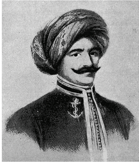
حسن الإسكندراني باشا.

طول مدة إقامته في الموانئ المصرية، ولا أن يخصم هذه المصاريف من الخراج الواجب عليه دفعه.» إلا أن محمد علي باشا رفض قبول مثل هذه المعاهدة الجائرة وملحقها؛ إذ إنه لم يدع إلى الاشتراك في وضع نصوصهما، وأعلن تمسكه بالبلاد التي فتحها جيوشه وأقرته عليها معاهدة كوتاهية في ٥ مايو سنة ١٨٢٣، فصمَّ على عدم نزوله عن أي شبر من هذه الأراضي، وأبلغ رفضه إلى الصدر الأعظم الذي بادر إلى استصدار فرمان بخلع محمد علي باشا من الولاية على مصر. وسرعان ما غادر ممثلو الدول الأجنبية الأراضي المصرية وأصبحت مصر بمفردها في حالة حرب ضد تركيا وحلفائها، بعد أن سحبت فرنسا تأييدها السابق لمصر وانسحبت من الميدان على إثر سقوط وزارة المسيو تيير المؤيدة لمحمد علي باشا في ٢٩ أكتوبر سنة ١٨٤٠ وقيام وزارة المسيو سولت التي تولى فيها المسيو جيزو وزارة الخارجية.